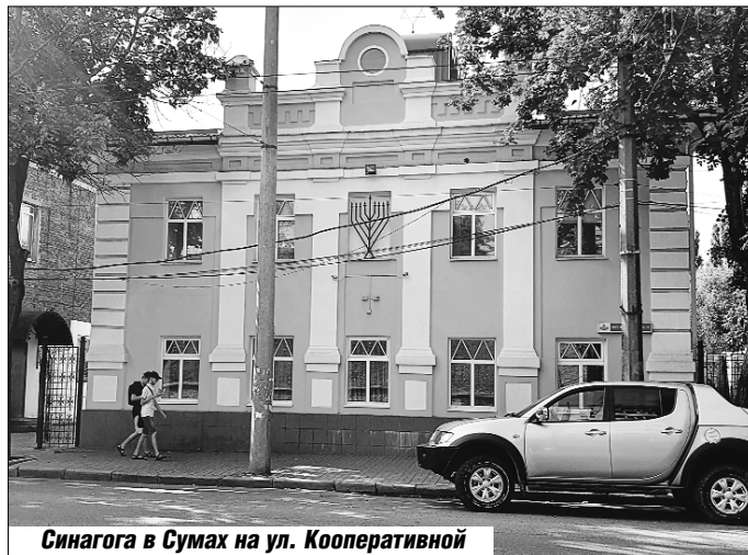
Синагога в Сумах на ул. Кооперативной

Как НКВД раскрыло в областном центре несуществующую подпольную организацию