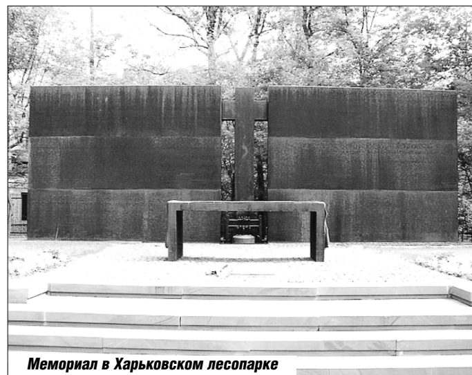
Мемориал в Харьковском лесопарке